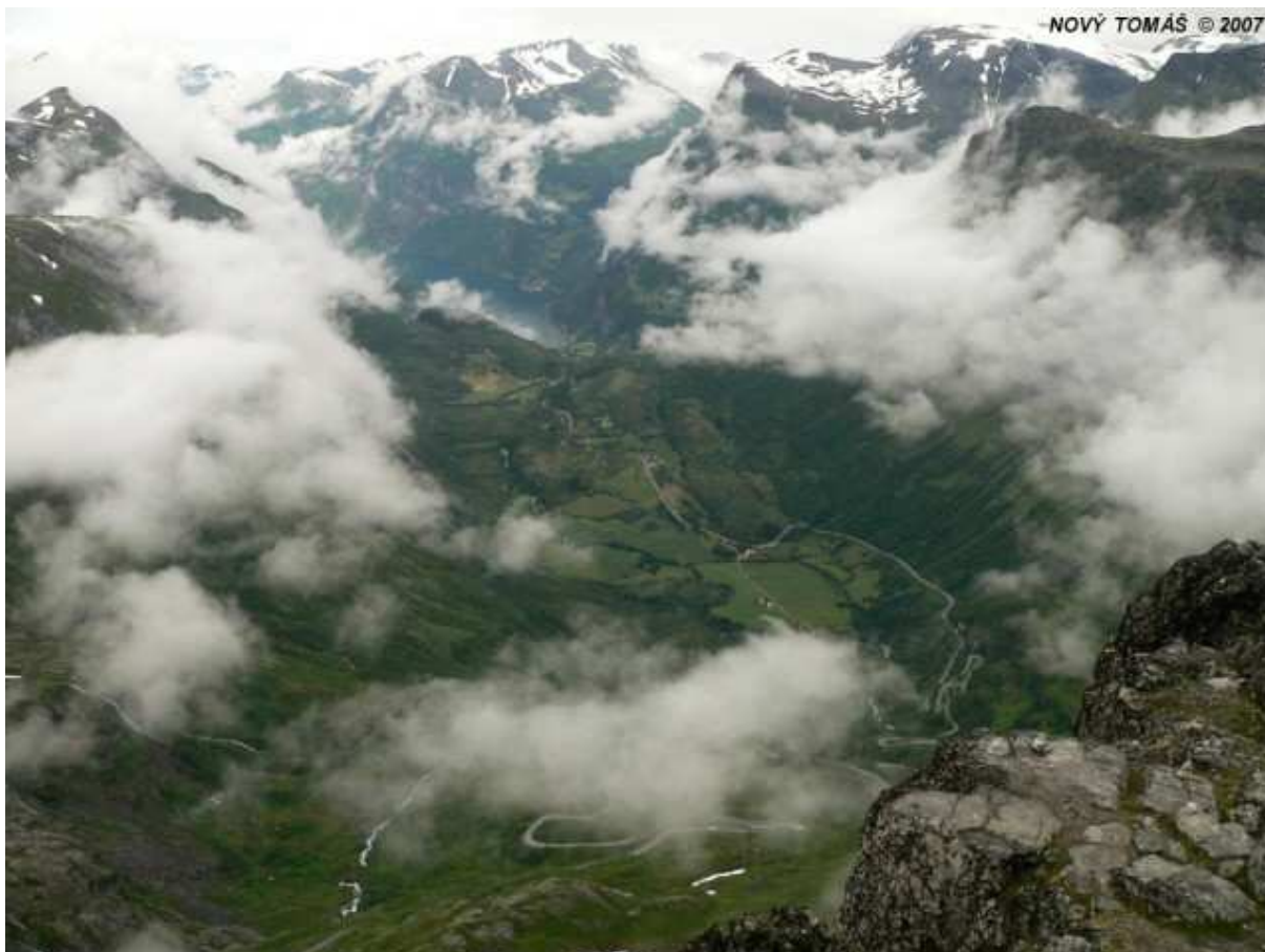
Dalsnibba - výhled na Geirangefjord (1500 m.n.m)

Přejedete do Vaddalu a odtud trajektem do Eidsdal. Odjedete Cestou orlů do Geirangeru, jednoho z nejkrásnějších fjordů Norska. Z městečka Geiranger vystoupáte až k jezeru Djupvasshytta a v případě hezkého počasí vyjedete na Dalsnibbu, skalnatou plošinu ve výšce 1500 m nad Geiranger fjordem, z níž se Vám naskytne pohled na dramatickou krajinnou scénérii.