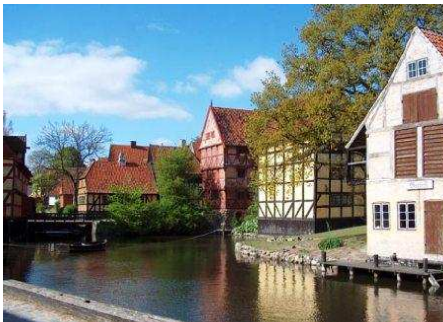
Den Gamle By

Ráno připlujete do Frederikshavnu. Odjedete do Århusu. Během cesty navštívíte oceánografické centrum Grenå, které je věnováno podmořskému životu severských moří, kde máte jedinečnou možnost vidět živé žraloky, tuleně a ostatní obyvatele oceánu. Pohladíte si přátelské Rejnoky, vyzkoušíte si simulátor batyskafu, nebo se pomocí 3D kina přenesete do hlubin oceánu. Ve městě Århus navštívíte skanzen starého města Den Gamle By, který Vás vrátí 300 let nazpět do minulosti Dánska. Je přehlídkou architektury, sbírek i ukázek běžného života dánského městečka. V odpoledních hodinách odjedete na hraniční přechod Flensburg do Německa.